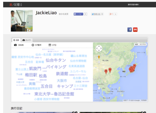
図5 個人ブログのページ

図3に示した「旅行日記」のページでは、写真やコメントなどの観光情報がタイムラインで連続的に表示される。また、地図上で観光の位置情報を表示する機能を図4に示す。これらの機能で観光客の移動経路または観光計画が把握できる。観光事業者はこの機能を用い、自分の観光計画を一般ユーザに紹介できる。一般ユーザは美しい写真を見て観光地の雰囲気が感じられ、その観光地に行きたいという意欲が高まる。そして、タイムラインで記載された文字や位置