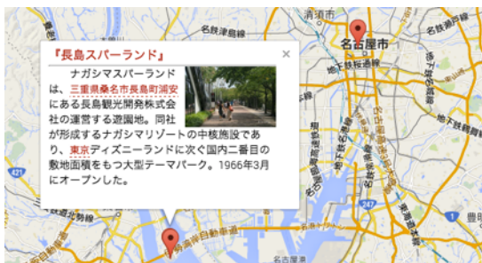
図4 地図での観光情報の表現

に示したホームページでは、ユーザのアップロードした「旅行日記」の表紙がランキングで一覧的に表示される。最上のバナーは観光事業者のために広告として利用できる。