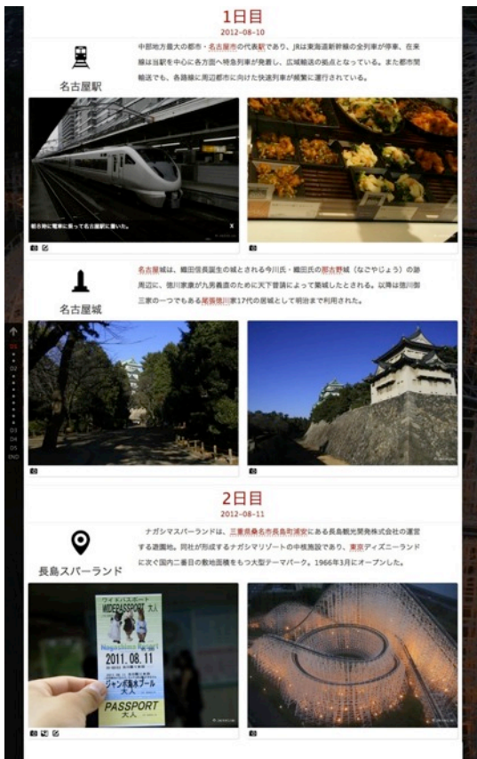
図3 タイムラインで観光情報の連続表示